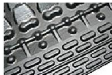
tesniace chlopne na spodnej strane minimalizujú znečistenie pod rohožou