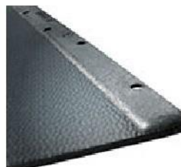
ukončovací profil na pravom okraji (WELA-R)

* Pred inštaláciou si pozorne prečítajte návod na montáž s užitočnými radami a tipmi.