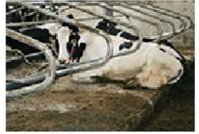
WELA LongLine in practice