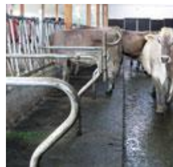
vhodná aj pre kŕmne maštale