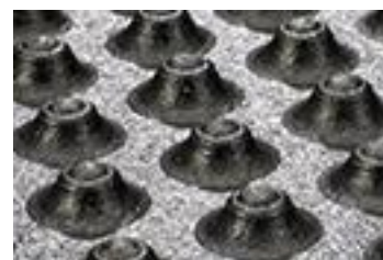
dvojitý štruktúrovaný profil na spodnej strane

+/- 1.5 % (DIN ISO 3302-1 trieda tolerancie M4)