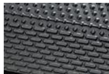
bariéra na spodnej strane