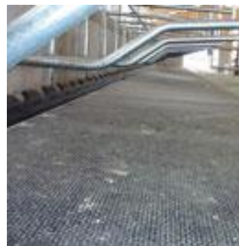
KIM LongLine v praxi