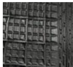
Tesniace pásy v zadnej časti

>Produkty tu uvedené by mali byť použité iba pre uvedené aplikácie. Technické špecifikácie podliehajú zmenám. Všetky predaje sú predmetom našich Všeobecných obchodných podmienok. Právny základ je nemecká verzia dokumentu.