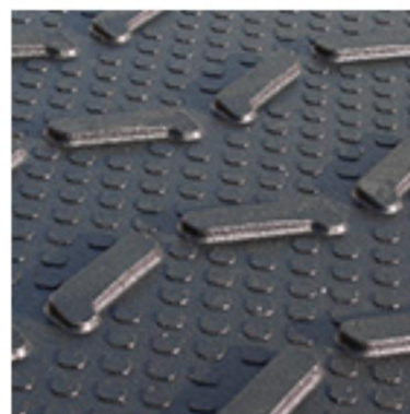
rebro profilu na povrchu